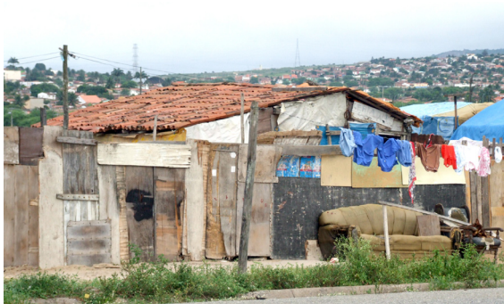
Imagem 03: Vizinhança do “Meninão”: tão próxima e tão distante do lazer

Entendemos que a atitude da Prefeitura Municipal de Campina Grande, que ainda hoje cobra da população taxas ditas simbólicas para a utilização do “Meninão”, reforça essa compreensão, afastando do esporte recreativo e do lazer, aqueles que mais precisam do seu amparo institucional, como é o caso das pessoas que vivem em condições precárias de moradia, ao lado do próprio “Meninão”.